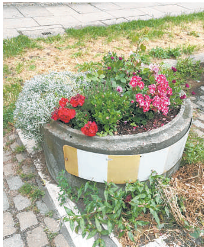
Der 3. Barmbeker Kübelkontest ruft zum Mitmachen auf: Erste Teilnehmer sind bereits aktiv – hier ein Vorher-/Nachher-Vergleich

BARMBEK Vom grauen Betonklotz zum blühenden Hingucker, vom tristen Straßenrand zur grünen Mini-Oase: Der Barmbeker Kübelkontest geht in die nächste Runde.