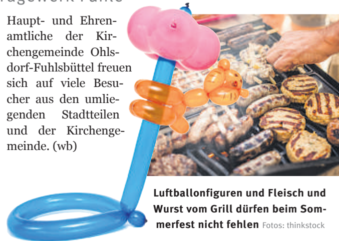
Luftballonfiguren und Fleisch und Wurst vom Grill dürfen beim Sommerfest nicht fehlen.

Haupt- und Ehrenamtliche der Kirchengemeinde Ohlsdorf-Fuhlsbüttel freuen sich auf viele Besucher aus den umliegenden Stadtteilen und der Kirchengemeinde. (wb)